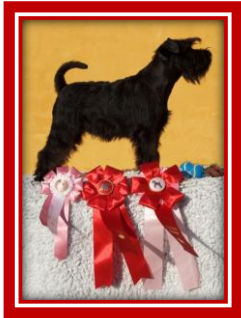
Sváva's Hazel (Tzefira)

Vi ønsker alle en glædelig jul og et godt nytår